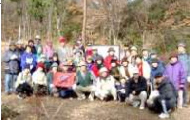
ゆずり葉森の広場に集合ハイキング

これを機に「ゆずり葉コミュニティ健康福祉部」は豊かな自然の宝、裏山の有効活用を実践する活動を始めました。四季の移り変わりを感じる緑と花が身近にあり、高齢者が無理なく、また家族が揃って歩くことのできる「健康づくりの散策路」があればと自前のハイキングコースづくりに着手しました。コースには光ガ丘、青葉台、北逆瀬台、西逆瀬台、ゆずり葉台から自由に入れるよう、行政が設置したフェンスなどの障害物を取り除き、下草刈りや開伐、植樹に加え、階段を作り、危険な急な山道にはロープを張るなどしました。また、コースに迷わないよう 5 色のコース標識、地図案内板、道標を設置しました。これは多くのボランティア参加者と里山