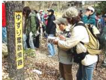
「ゆずり葉散策路」の道標