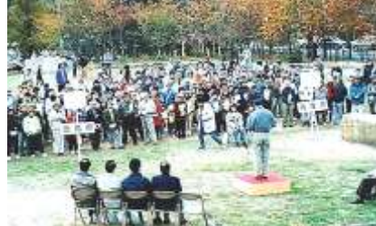
平成 10 年 11 月 22 日植樹祭を開催