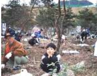
アヴェルデ・県立西高裏側