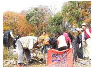
毎年行われてきた植樹祭

今年には阪神大震災から 21 年、宝塚市の犠牲者追悼行事としてゆずり葉緑地公園「鎮魂之碑」の下で献花・記帳を毎年 1 月 17 日に開催してきましたが、碑はこの春に末広中央公園へ移設され、今年が最後となりました。