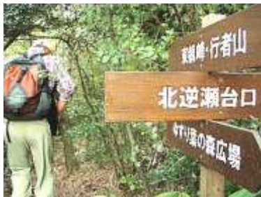
「櫻守の会」がコース指標整備