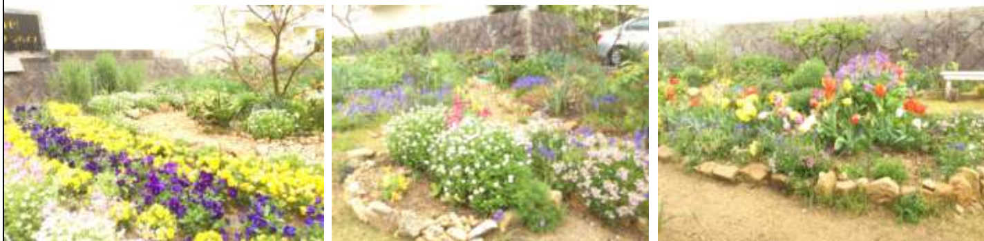
広いスペースに広がるグリーンハイツの花壇

私達のまちの花壇、ボランティアさんがしっかりと手入れを下さっています。 四季折々、花の変化で目を楽しませ癒しを与えてくれます。 ボランティアの皆さん、有り難うございます。