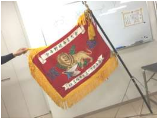
宝塚市少年野球春季大会優勝旗

(編集発行)「知らせましょ・咲かせましょ」事務局・広報(住所)宝塚市逆瀬台 URL http://www.shirasaka8.net/ 連絡先 「知ら咲か」ホームページの“問い合わせ”をご利用下さい。