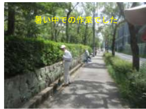
暑い中での作業でした