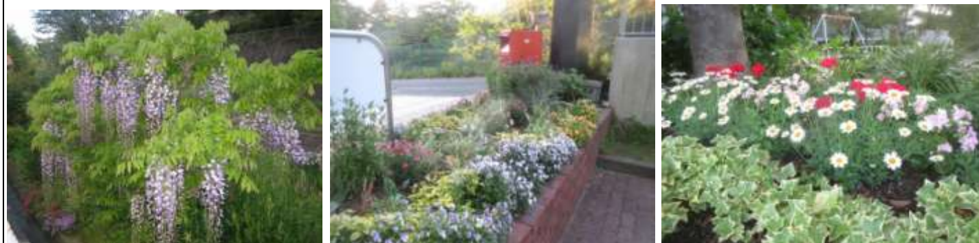
アヴェルデ横パーゴラ広場