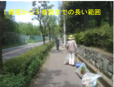
1 番館から 5 番館までの長い範囲