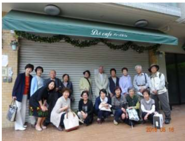
アヴェルデに帰着、また今度も一緒に！