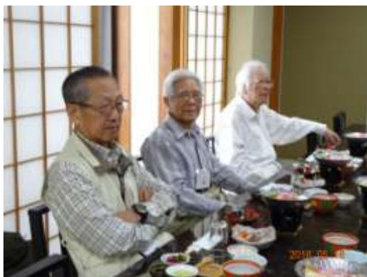
もうすぐ「いただきます」

お風呂のあとはビールが美味しい！お風呂の中でも「でんでんむしむし」って歌ったわよね～