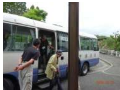
玄関前で“はいポーズ”

健康浴場を利用する前に、体と心のほぐしをめざしてパートナーソングを合唱しました。パートナーソングは複数の歌を同時に歌うのですが、コード進行や楽曲の構成が似ているので、通常の合唱曲のようにパート練習をしなくても楽しくハーモニーを作れます。