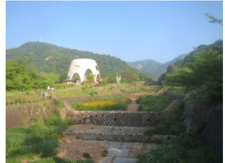
論鶴羽橋からの緑地

ゆずり葉緑地の入り口部分の石畳のエントランス広場と砂防モニュメントの前の芝生広場に5つの石彫作品があります。緑地に立ち寄っても意識して見る人が何人いるでしょう。一つ一つの作品をじっくり見ると何かを感じるかも知れません。