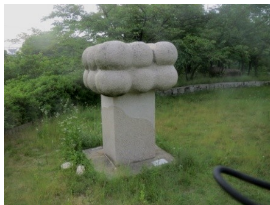
「実のなる樹」 辻 弘 作