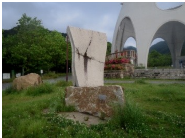
「帆」 大垣 圭介 作