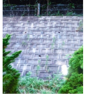
県立宝塚西高等学校

ではなぜ、土砂災害発生防止対策がとられていながら、「土砂災害警戒区域」に指定されているのかを、県土整備部土木局砂防課土砂災害対策係の担当者にお聞きしました。