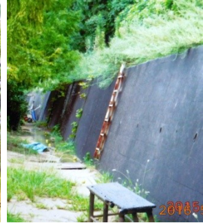
県立宝塚高等学校