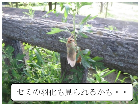
セミの羽化も見られるかも・・・