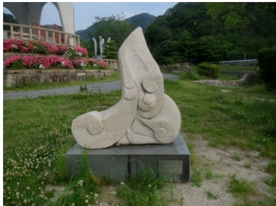
「鳥のように」 小川 陸朗 作

石彫にはいろいろな魅力があるようです。 硬い石なのに柔らかく感じられる作品も あれば堅さを活かした作品もあります。 芸術の奥深さとでも言うのでしょうか。