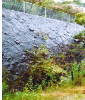
市立逆瀬台小学校