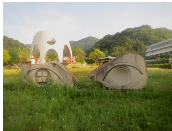
「光の舞台」 北野 正治 作

作品は石畳の上にあったり芝生の中に置かれて います。美術館の中にあるものと違い自然 との調和も見られるので、色々な角度からの 楽しみ方がいっぱいあるようです。