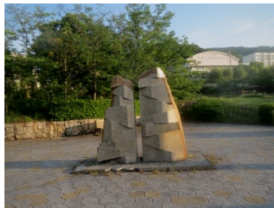
「風と光と足跡」 中農美枝子 作