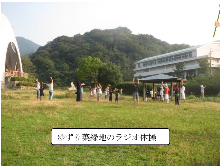
ゆずり葉緑地のラジオ体操