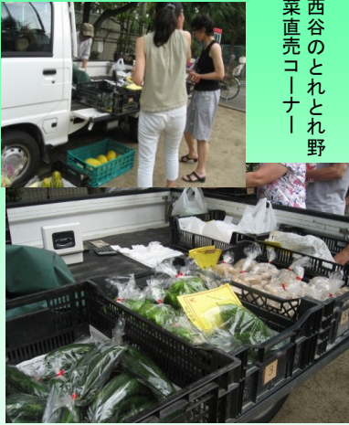
西谷のとれとれ野 菜直売コーナー

多少の雨にあいましたが、プログラ ム通り進行され、ファイナーレは花火を 楽しみました。 グリーンハイツ自治会の実行委員の 皆さま、大変大変ご苦勞様でした。