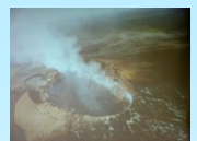
大型スクリーンに投射される 映像もまじえての公演でした

まるでハワイの海辺 にいるような雰囲気で す。「パレファ」をオー プニングに、前半5曲。