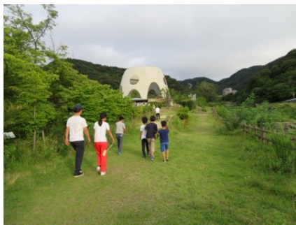
みんなで誘いあって会場へ

ゆずり葉緑地公園の「夏休み子どもと皆のラジオ体操」は多くの方が参加しました。朝の散歩と組み合わせる年中、ラジオ体操に参加している方達がお世話を下さいます。又、子ども達も出席カードに参加シールを貼る役を分担してくれました。ポスターに記載した8月1日を待たず、7月中から日ごとに参加者が増えてきました。1日には広場いっぱいになり、元気がいっぱい身体を動かしました。