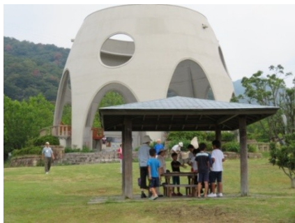
出席シールを貼りました

集まりました。広々としたモニユメントの前のスペースで自分の場所を選び体操をしました。緑に囲まれた会場で、蝉やバッタ、トンボもたくさん目にしました。「蝉は何を食べるのかな?」「バッタは緑色だけでなく茶色いのもいるよね」等々、観察会も同時に進行していました。台風の影響で雨の心配をしながらも、あつという間の一週間でした。7日にはみんなで記念撮影をしました。7日以降もまだ体操会は続いています。是非、参加下さい。