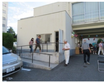
グリーンサロン・憩

「グリーンサロン・憩」ではガラス工芸品、ロマンドール人形、ブリザードフラワー、布製作品等の手作り品と日用品類のバザーが行われ格安お値打ち品が多く並んで今した。