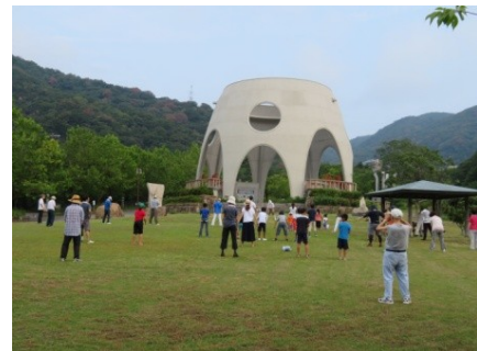
広場いっぱいに広がって・・・