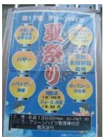
福引抽選会会場 下は子供花火

場椅子も満席になり立ち見も増えてきました。おなじみの「カイマナ ヒラ」から「プリア リリア」まで 40 分間を一人で受け持たれました。6 時半からはいよいよお、