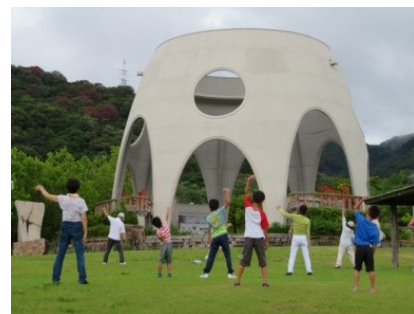
多い日には50名以上が元気に体操