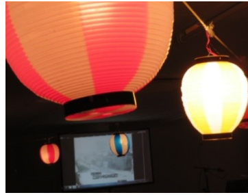
懐かしの歌謡曲と黄昏のハワイアン

「グリーンサロン・憩」ではガラス工芸品、ロマンドール人形、ブリザードフラワー、布製作品等の手作り品と日用品類のバザーが行われ格安お値打ち品が多く並んで今した。