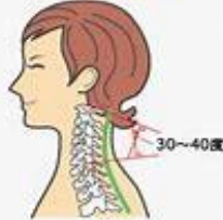
正常な人は30~40度、自然なカーブです。

正常な前弯角度は、30~40度ですが、ストレートネックでは30度以下。元々、何らかの影響でこの状態になっている人も多いですが、さらにスマホの利用などで長時間うつむいていることで、より首の生理的カーブがなくなり、症状がひどくなります。