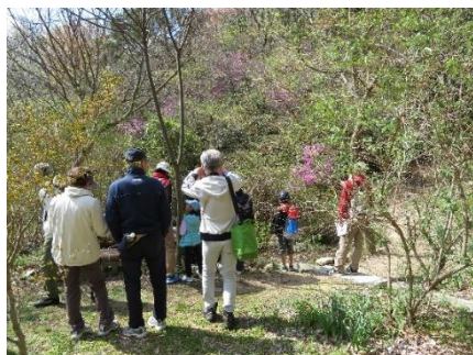
光青橋を渡り青葉台へ