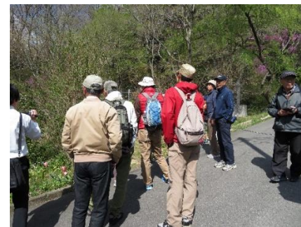
光が丘の街並を見て歩く