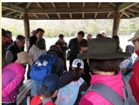
東家で凧づくり説明