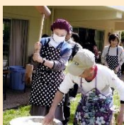
もちつきを元気に楽しく