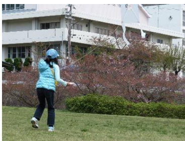
自作の凧を揚げる