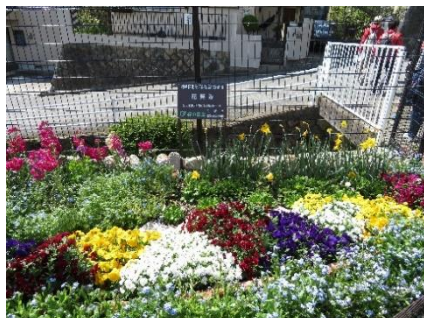
白瀬川沿いを上る