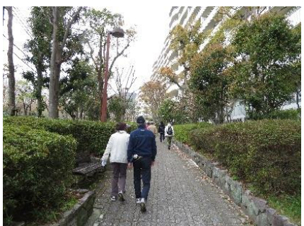
アヴェルデ遊歩道