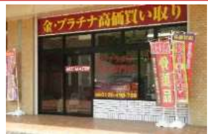
アヴェルデ 4 番館 1 階(駐車場あります)