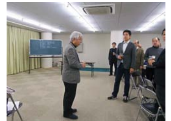
福島顧問の中締め