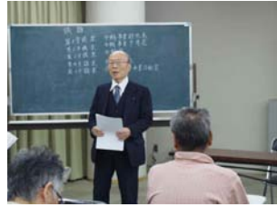
総会に引き続き懇親会