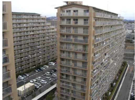
7棟ある加古川グリーンシティ 上層階からの景色

「知ら咲か」さまも加古川グリーンシティさまに負けないくらいの熱い思いがありますし、「知ら咲か」流の「防災や見守り・支えあい」を築けていただければと思います。加古川グリーンシティさまに追いつけ、追い越せの思いで今後も皆さまと共に取り組んでいきたいと思っております。