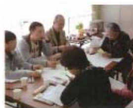
写真② 先進地域の事例を検討