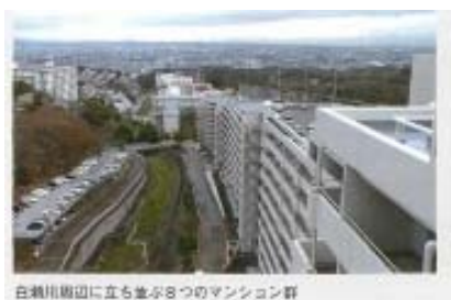
白瀬川両岸に立ち並ぶ8つのマンション群

CLC (特定非営利活動法人 全国コミュニティライフサポートセンター) の事例集「地域とつながる集合住宅団地の支え合いーコミュニティ力ですすめる 12 の実践」(DVD 付き) に白瀬川ブロックの活動が掲載されました。冊子は各マンションにお配りしていますのでご覧ください。