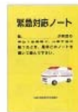
写真① 白瀬川ブロック版「緊急対応ノート」