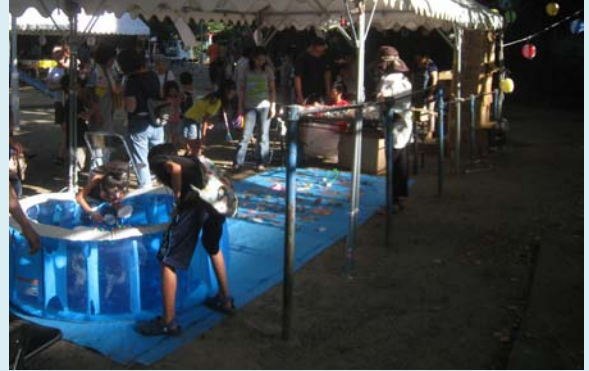
昨年のグリーンハイツ夏祭りスナップ